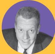
Tage Danielssons förnamn klättrar på namntoppen.