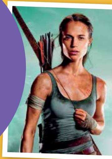
Alicia Vikander som Lara Croft i Tomb raider.