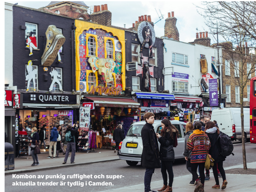
Kombon av punkig ruffighet och superaktuella trender är tydlig i Camden.

Och kanske är det just det som lockat så många att vilja vila här? Sex Pistols manager Malcolm McLaren ligger på Highgate, liksom popstjärnan George Michael och den ryske tidigare officeren Alexander Litvinenko, som förgiftades med polonium 2006 och dog i London. Levande eller död vill man helt enkelt vara här, känns det som. De som bor i Hampstead, Highgate, Belsize Park eller Camden lämnar ogärna sitt ”village” om de inte måste. Och de som någon gång har hälsat på kommer nästan alltid snabbt tillbaka.