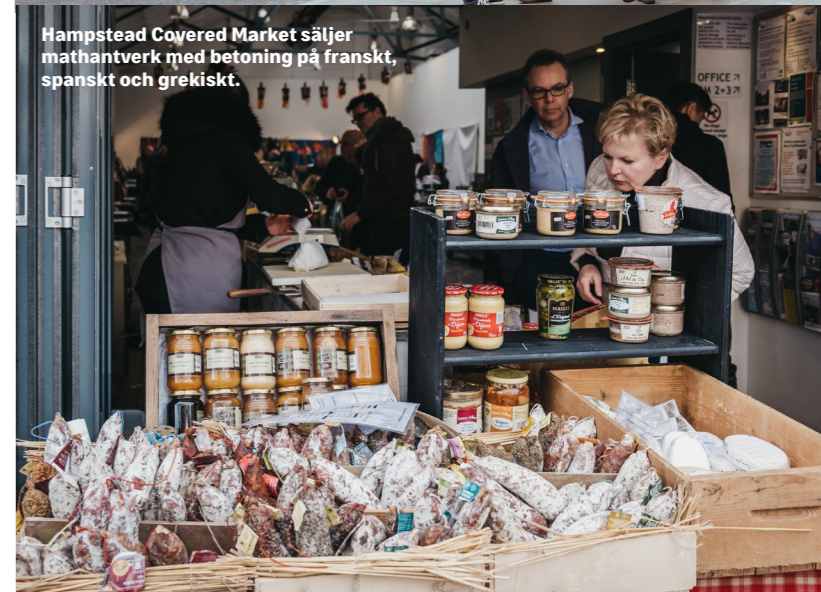
Hampstead Covered Market säljer mathantverk med betoning på franskt, spanskt och grekiskt.