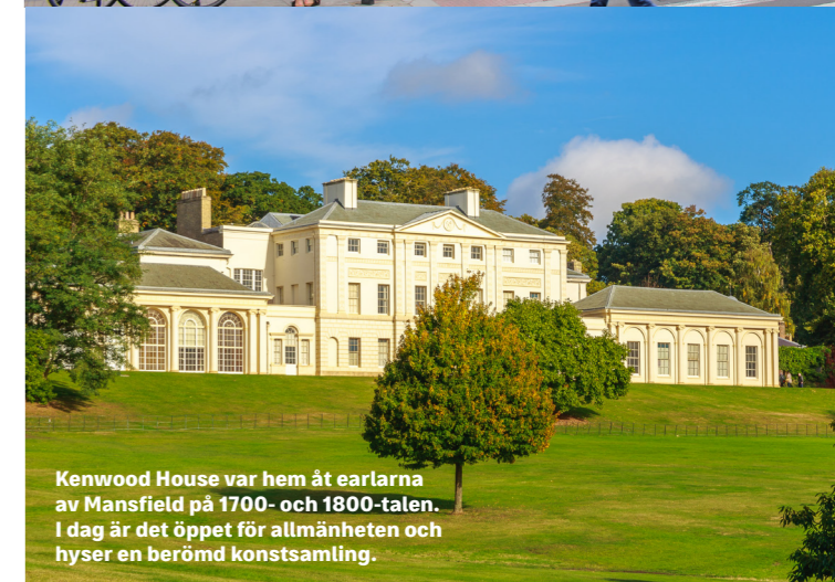
Kenwood House var hem åt earlarna av Mansfield på 1700- och 1800-talen. I dag är det öppet för allmänheten och hyser en berömd konstsamling.

”Jag håller mig till höger, svänger in på Eton Avenue, stannar till på den lilla piazzan som gör hela skillnaden och andas djupt”