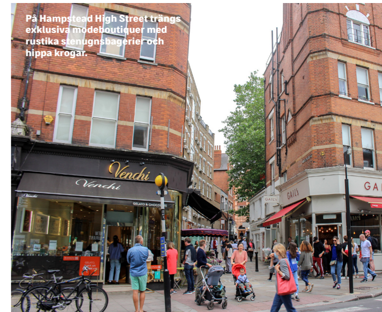
På Hampstead High Street trängs exklusiva modeboutiquer med rustika stenugnsbagerier och hipa krogar.