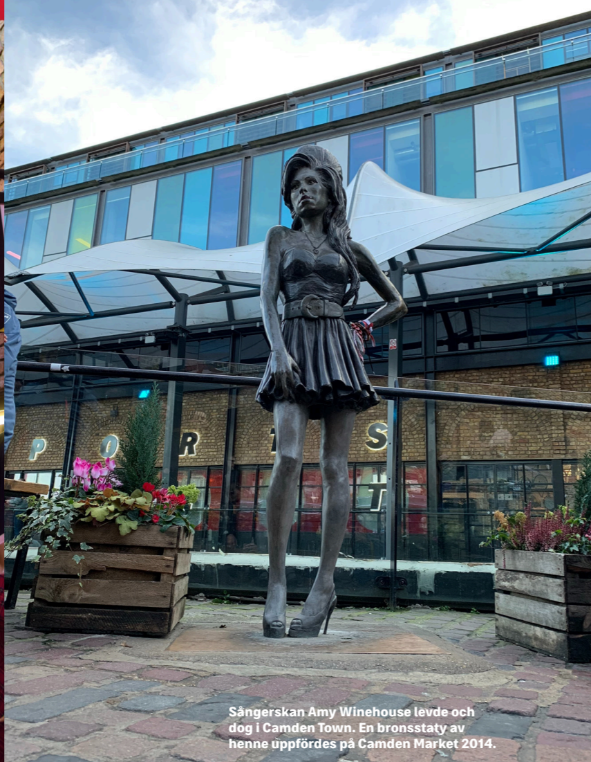
Sångerskan Amy Winehouse levde och dog i Camden Town. En bronsstaty av henne uppfördes på Camden Market 2014.