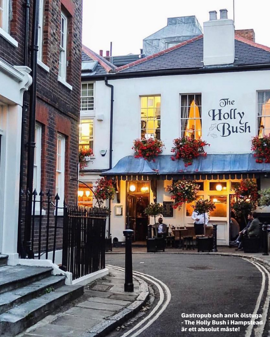
Gastropub och anrik ölstuga - The Holly Bush i Hampstead är ett absolut måste!