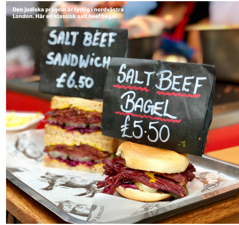
Den judiska prägel är tydlig i nordvästra London. Här en klassisk salt beef baget.

Nej, det är ingen risk att man går hungrig i Hampstead Village, vare sig det gäller judiska, syd- eller centraleuropeiska eller riktigt urbrittiska paradnummer. För att hinna smaka sig igenom alla prisbelönda småhak längs med huvudgatan och dess tvärgående små gränder hade man behövt en månad, minst.