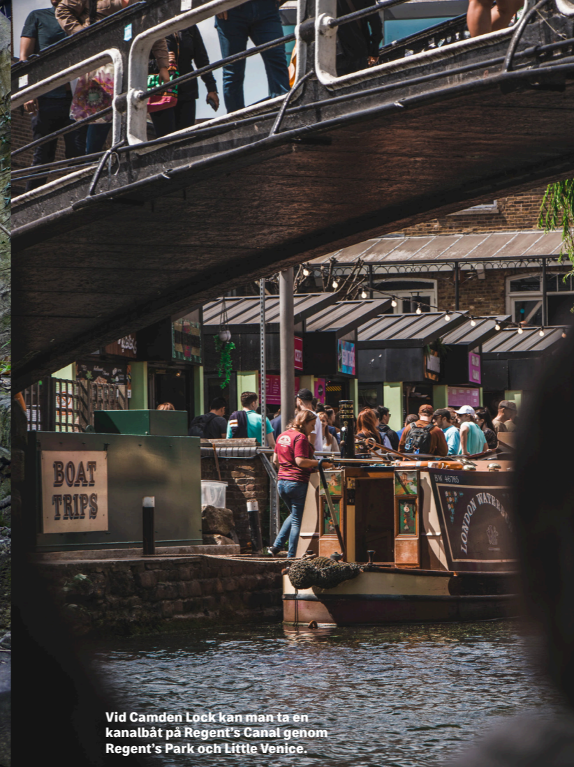
Vid Camden Lock kan man ta en kanalbåt på Regent's Canal genom Regent's Park och Little Venice.