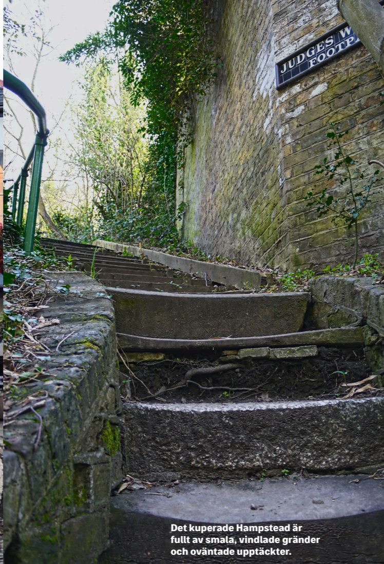
Det kuperade Hampstead är fullt av smala, vindlade gränder och oväntade upptäckter.