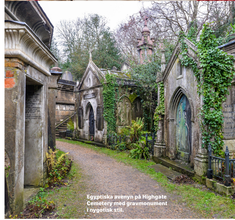
Egyptiska avenyn på Highgate Cemetery med gravmonument i nygotisk stil.