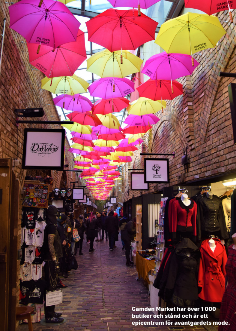
Camden Market har över 1000 butiker och stånd och är ett epicentrum för avantgardets mode.